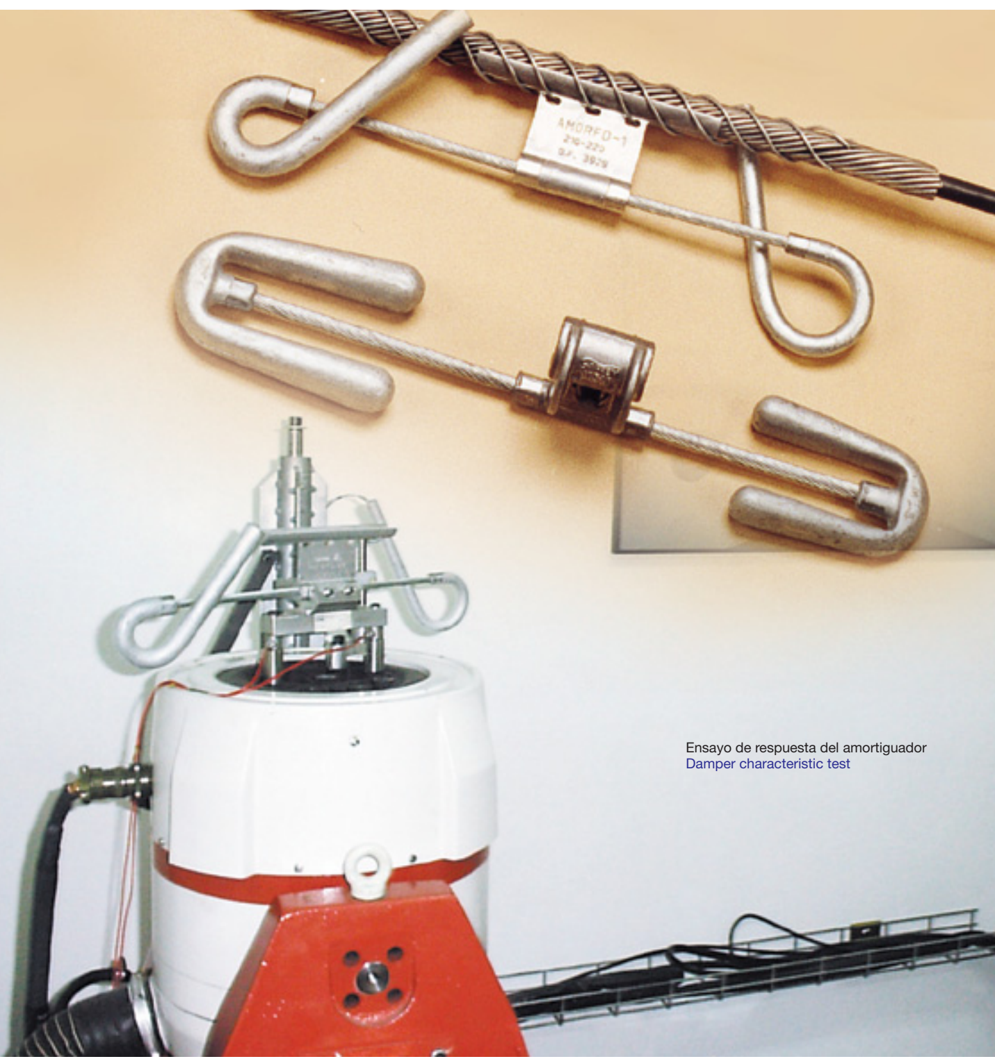
Ensayo de respuesta del amortiguador Damper characteristic test